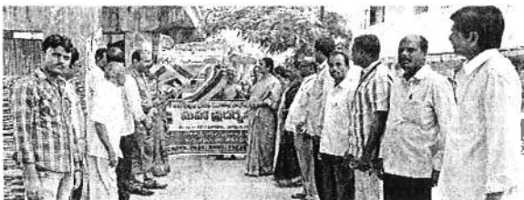
ర్యాలీ నిర్వహిస్తున్న సహకార సంఘాల సభ్యులు