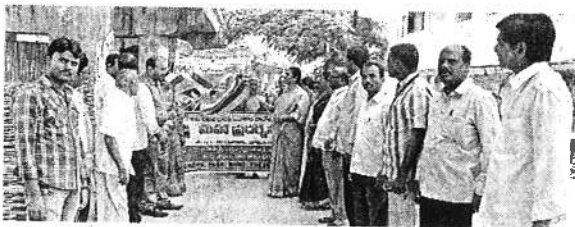
ర్యాలీ నిర్వహిస్తున్న సహకార సంఘాల సభ్యులు